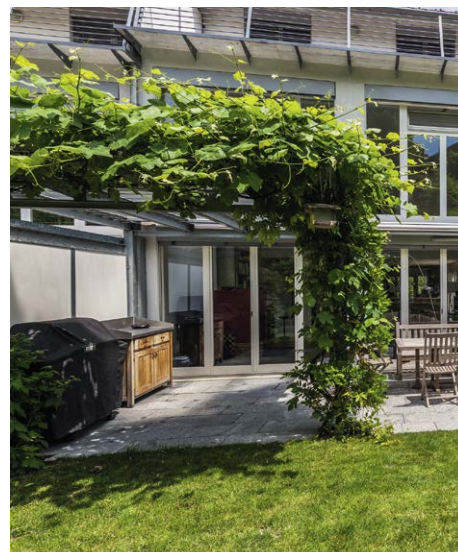
Eine Pergola spendet Schatten und trägt stimmig zum Gesamtbild bei.

Sehr beliebt sind auch Alleebäume, deren Krone einen breiten flachen Charakter hat. Es sind dies in «Dachform» geschnittene und flachgezogene Züchtungen. So gezogene Gehölze vermitteln Leichtigkeit und sind ein willkommener Sonnenschutz bei einem Gartensitzplatz und auch bestens geeignet für begrenzte Platzverhältnisse. Ist ein Baum in der Nähe des Wohngebäudes geplant, sollte ein Gehölz mit lichter Krone und feinem Laub gepflanzt werden. So werden durch den Schattenwurf die eigenen Wohnräume nicht zu Dunkelkammern.